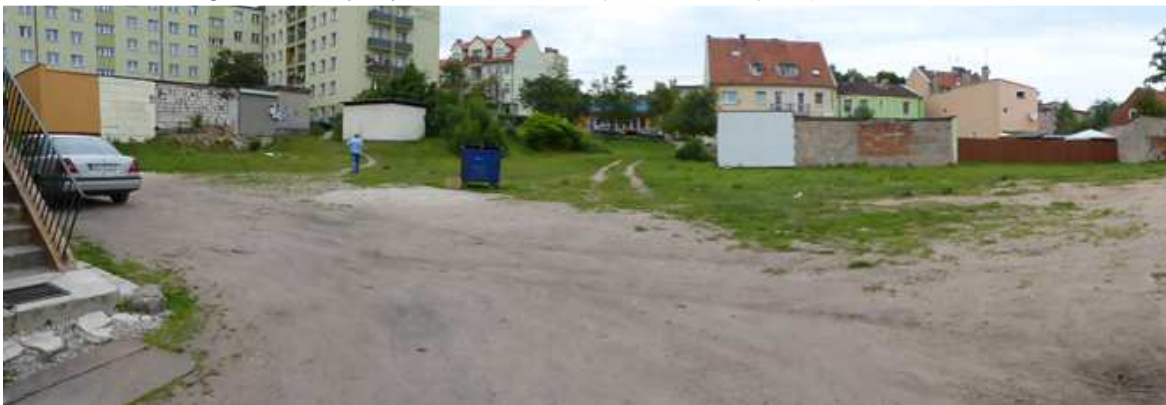
Ryc.2 Wnętrze terenu projektu Planu

W najbliższym otoczeniu planów znajdują się tereny o podobnym charakterze i przeznaczeniu jak proponowane w projekcie planu. Badany obszar stanowi enklawę wśród zabudowy miejskiej miasta Olecko. Charakter zawarty w projekcie planu jest dalszą kontynuacją rozbudowy miasta. Miasto posiada pełną infrastrukturę w celu zaopatrzenia projektowanych inwestycji w media (wodociąg miejski, kanalizacja sanitarna, kanalizacja deszczowa, zorganizowany wywóz śmieci, ciepłownia miejska).